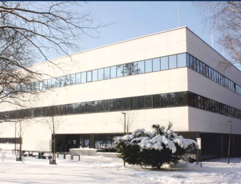
Centrum Innowacyjnej Edukacji Medycznej i Biblioteka Medyczna