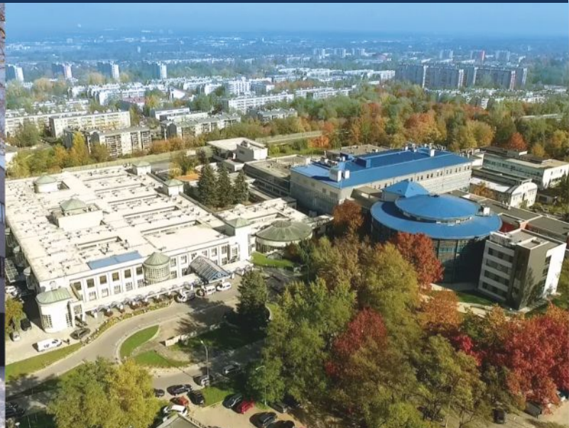
Uniwersytecki Szpital Dziecięcy – największy szpital pediatryczny w Małopolsce