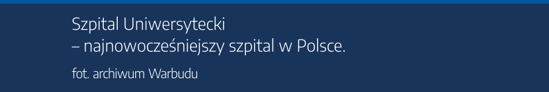
Szpital Uniwersytecki – najnowocześniejszy szpital w Polsce.