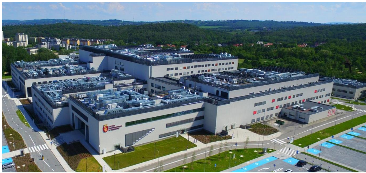
Szpital Uniwersytecki – najnowocześniejszy szpital w Polsce, wiodący ośrodek, który łączy doświadczenie i tradycję z najnowszymi trendami w medycynie