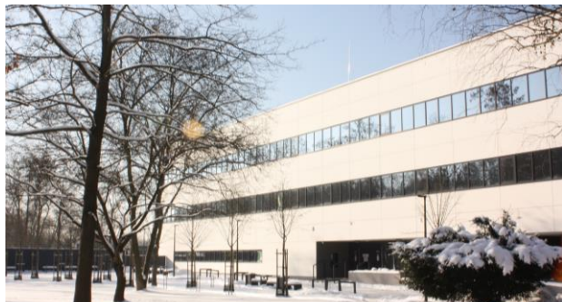
Centrum Innowacyjnej Edukacji Medycznej – baza dydaktyczna dla studentów medycyny, stomatologii, pielęgniarstwa i położnictwa