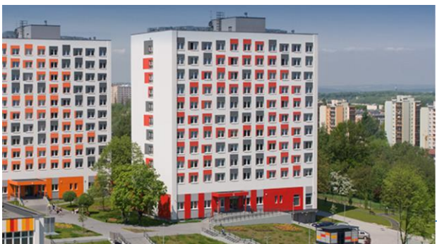
Domy studenckie z kompleksem sportowym