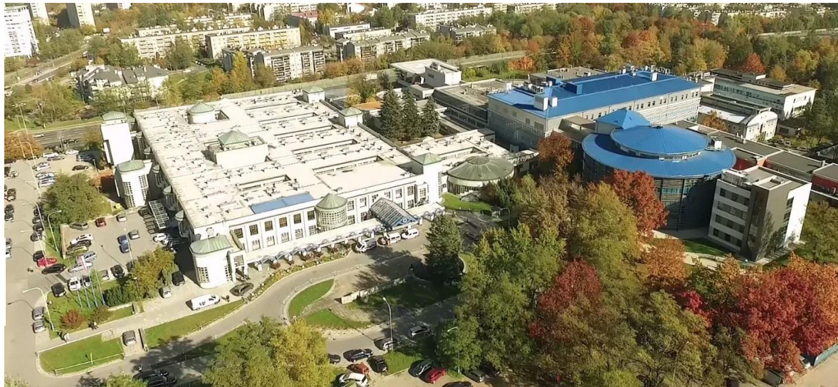
Uniwersytecki Szpital Dziecięcy – największy szpital pediatriczny w Małopolsce