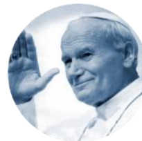
Jan Paweł II