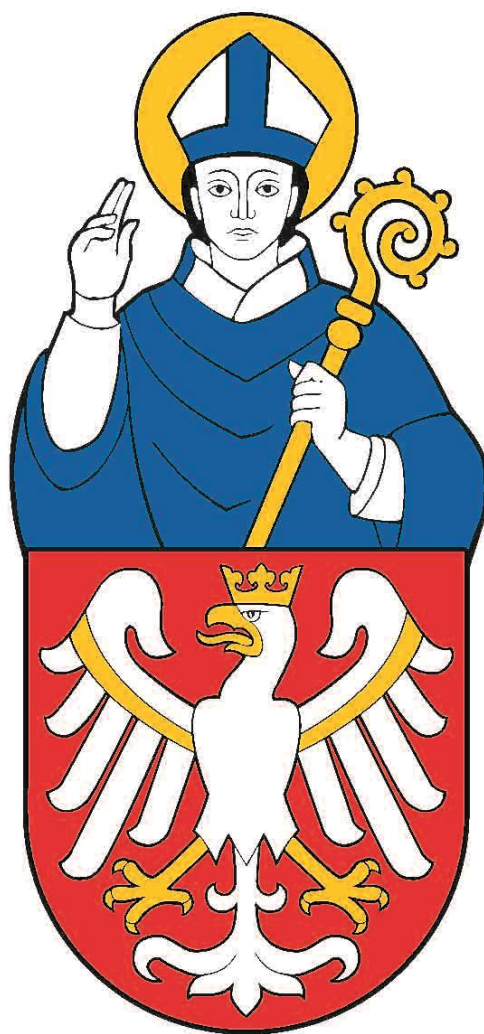
Wzór tradycyjnego herbu Uniwersytetu Jagiellońskiego