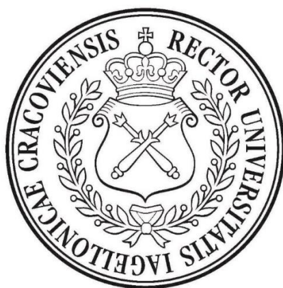
Pieczęć mniejsza Uniwersytetu Jagiellońskiego (średnica 45 mm)