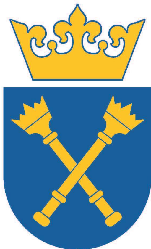
Wzór herbu Uniwersytetu Jagiellońskiego