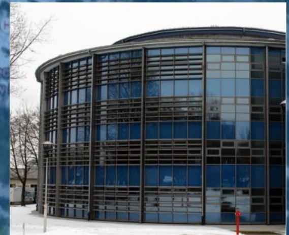
Uniwersytecki Szpital Dziecięcy