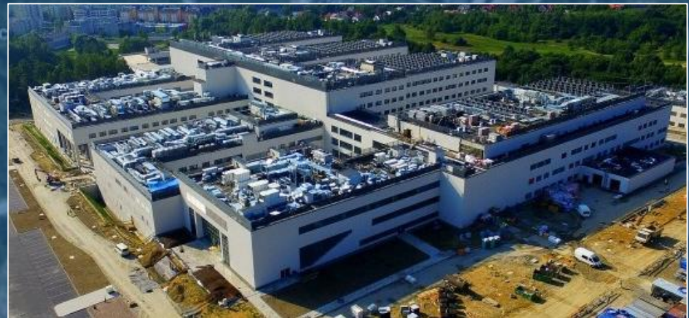
Nowa siedziba Szpitala Uniwersyteckiego