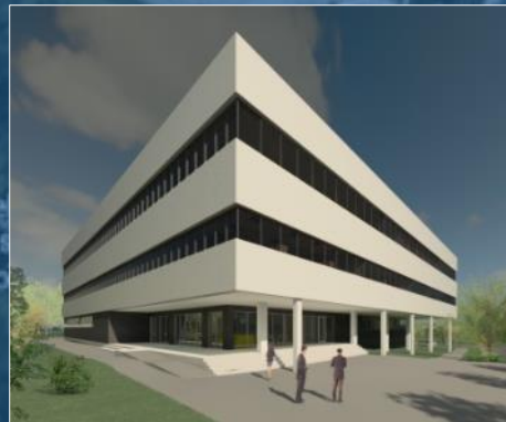
Centrum Innowacyjnej Edukacji Medycznej z Biblioteką Medyczną