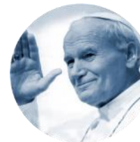
Jan Paweł II