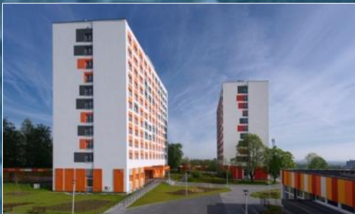
Domy studenckie z kompleksem sportowym