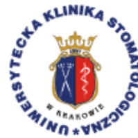
Uniwersytecka Klinika Stomatologiczna